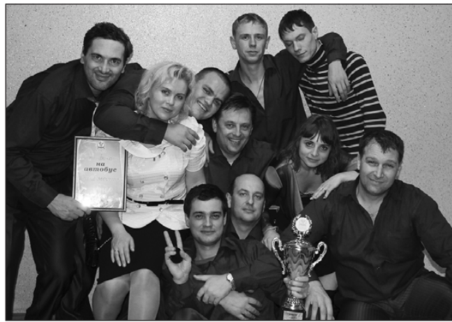
Команда КВН «Бригада» выступила на «Ура» и заняла второе место