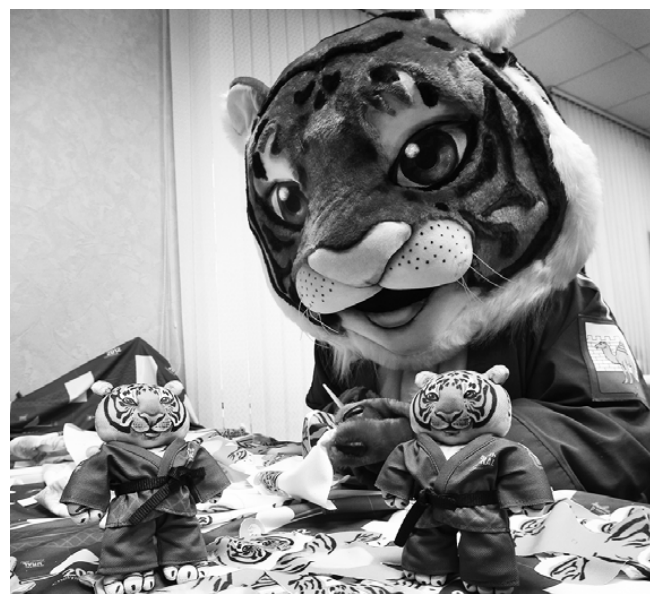
В мастерской один за другим уже появляются двадцатисантиметровые тигрята одетые в кимоно

Процесс производства требует немало усилий и кропотливого труда. При изготовлении талисмана используется метод сублимационной печати, который позволяет получить изображение высокого качества. Сначала рисунок будущей игрушки переносят на специальную ткань — пике, которая, кстати, используется при пошиве спортивной одежды. После этого выкройку вырезают и сшивают детали.