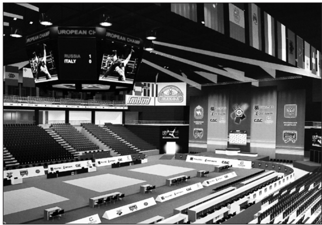
К Чемпионату ледовый дворец преобразился

Грядущий чемпионат по дзюдо — грандиозное событие не только для Челябинска, но и для всей России. Впервые в нашей стране будет проходить первенство Старого Света.